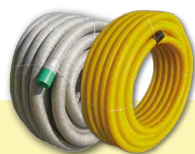
SYSTEMY DRENARSKIE DR