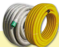
SYSTEMY DRENARSKIE DR