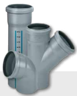
KANALIZACJA WEWNĘTRZNA NISKOSZUMOWA HT PLUS