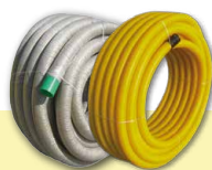
SYSTEMY DRENARSKIE DR