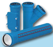
KANALIZACJA WEWNĘTRZNA NISKOSZUMOWA ULTRA dB