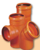
KANALIZACJA ZEWNĘTRZNA KG