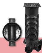
STUDNIE KANALIZACYJNE SC