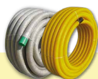
SYSTEMY DRENARSKIE DR