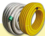
SYSTEMY DRENARSKIE DR