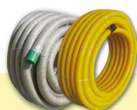
SYSTEMY DRENARSKIE DR