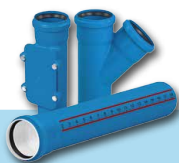
KANALIZACJA WEWNĘTRZNA NISKOSZUMOWA ULTRA dB