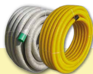
SYSTEMY DRENARSKIE DR